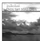
神だけが 定価2,500円(税込)