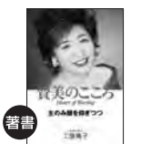
賛美のこころ 定価1,600円(税込) (注※)