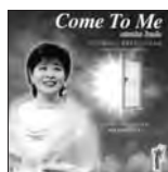
Come To Me 定価3,000円(税込)