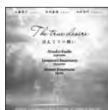
ほんとうの願い 定価3,000円(税込)