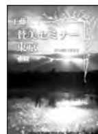
賛美セミナー I CD 4枚組 '13年11月9日東京セミナー録音 定価4,000円(税込)

賛美セミナーIIと賛美セミナーIのアイテムを合わせてご注文される場合、特別価格でお求めいただけます。その際は、オンラインストアではなく、メール、電話、ファックスでお申し込みください。