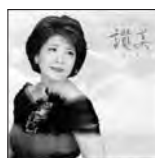
讃美 Adorar 定価1,500円(税込)