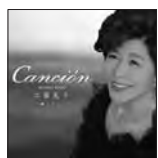
カンシオン 定価2,500円(税込)