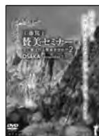
賛美セミナー II DVD 2枚組 '15年11月7日大阪セミナー録画 定価4,000円(税込)