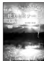
賛美セミナー I DVD 2枚組 '13年11月4日大阪セミナー録画 定価4,000円(税込)