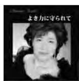
よき力に守られて 定価2,500円(税込)